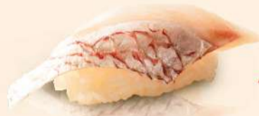
NG03. 鯛 Tai Fresh Sea Bream RM18