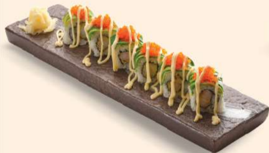
HS01. ドラゴンロール Dragon Roll Deep-fried Shrimp & Avocado RM48