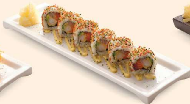
HS10. シーフードロール Seafood Roll Deep-fried Shrimp, Fresh Salmon, Tuna & Yellowtail RM48