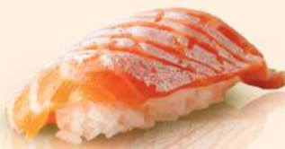
NG06. サーモンベリー Salmon Belly Fresh Salmon Belly RM16