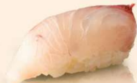
NG02. はまち Hamachi Fresh Yellowtail RM18