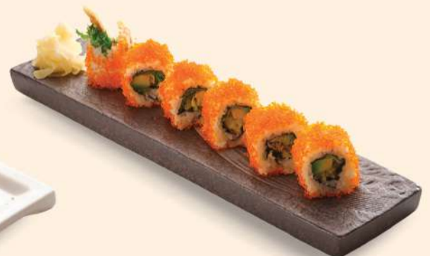
HS11. ソフトシェルクラブロール Soft Shell Crab Roll Deep-fried Soft Shell Crab RM49