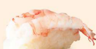
NG11. 甘エビ Ama Ebi Fresh Sweet Shrimp RM28