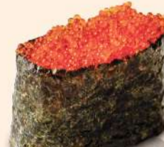
NG15. とびこ Tobikko Flying Fish Roe RM19