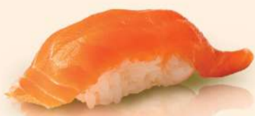
NG05. サーモン Salmon Fresh Salmon Trout RM10