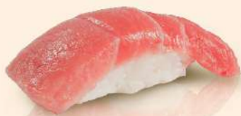
NG01. トロ Toro Fresh Tuna Belly RM52