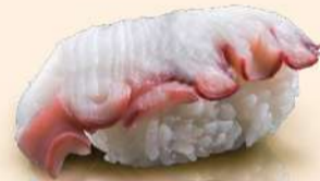
NG08. 蛸 Tako Boiled Octopus RM10