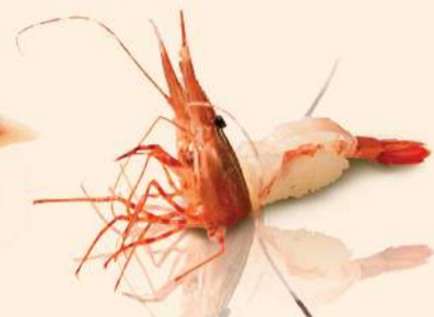
NG04. 牡丹海老 Botan Ebi Fresh Botan Shrimp RM60