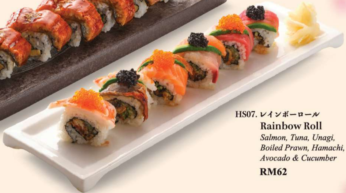
HS07. レインボーロール Rainbow Roll Salmon, Tuna, Unagi, Boiled Prawn, Hamachi, Avocado & Cucumber RM62