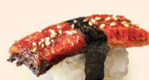
NG12. 上鰻 Jo Unagi Grilled Eel RM20