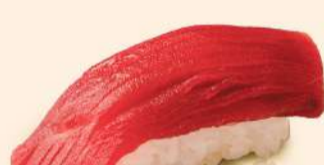
NG10. 鮪 Nama Maguro Japanese Fresh Tuna RM23