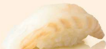
NG09. 平目 Hirame Fresh Flounder RM18