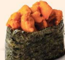
NG16. ウニ Uni Sea Urchin Seasonal Price RM60 - RM65