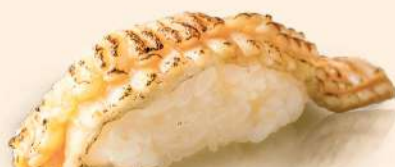
NG13. 炙りエンガワ Aburi Engawa Half-broiled Flounder Fins RM28