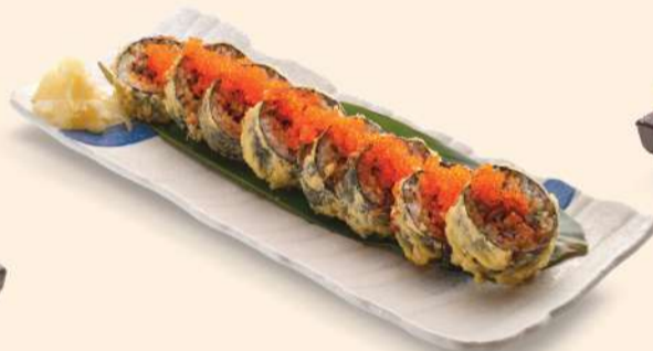
HS02. 鰻とチリパディ巻き薄口揚げ Unagi To Chilli Padi Maki Usukuchi Age Grilled Eel Rolled Sushi with "Chilli Padi" Tempura RM38 (4 pieces) RM68 (8 pieces)