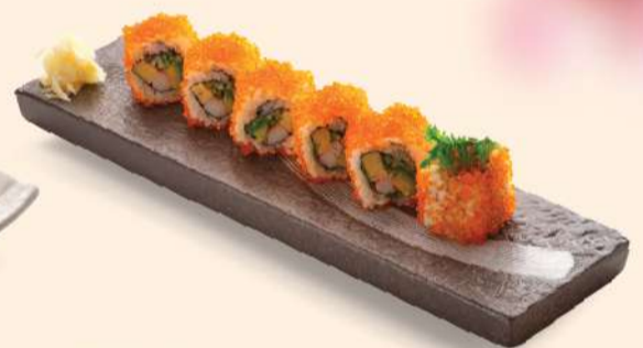
HS06. カリフォルニアロール California Roll Crab Stick, Japanese Omelette, Avocado & Cucumber RM42