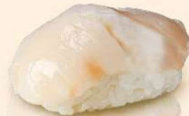
NG07. 生ホタテ Nama Hotate Fresh Hokkaido Scallop RM22