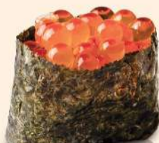
NG14. いくら Ikura Salmon Roe RM32