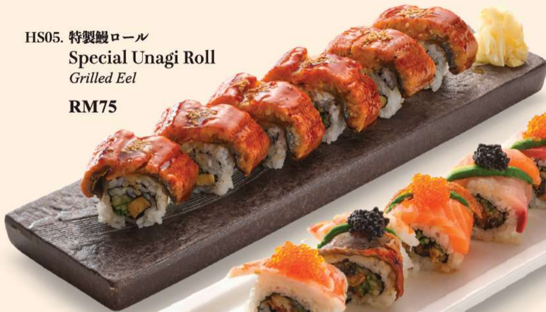
HS05. 特製鰻ロール Special Unagi Roll Grilled Eel RM75