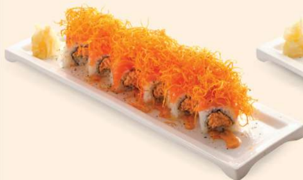
HS09. スパイシーサーモンロール Spicy Salmon Roll Fresh Salmon & Spicy Salmon Mayo RM48